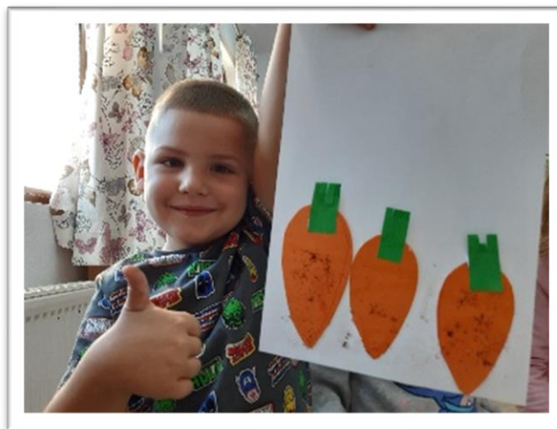
Leren over groente

Alle (28) kinderen die onze kleuterschoolactiviteiten bezocht hebben, hebben hele goede resultaten op de lagere school. Eveneens worden de ouders geïnstrueerd en is er een mentaliteitsverandering waar te nemen. Van vorige groepen zijn er 5 leraar geworden en 18 kinderen hebben de middelbare school afgerond.