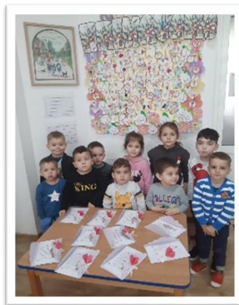
Kleuterklas in Casa Lumina

Alles wat aangeboden wordt, is gratis voor de kinderen (en ouders) en omvat het volgende: