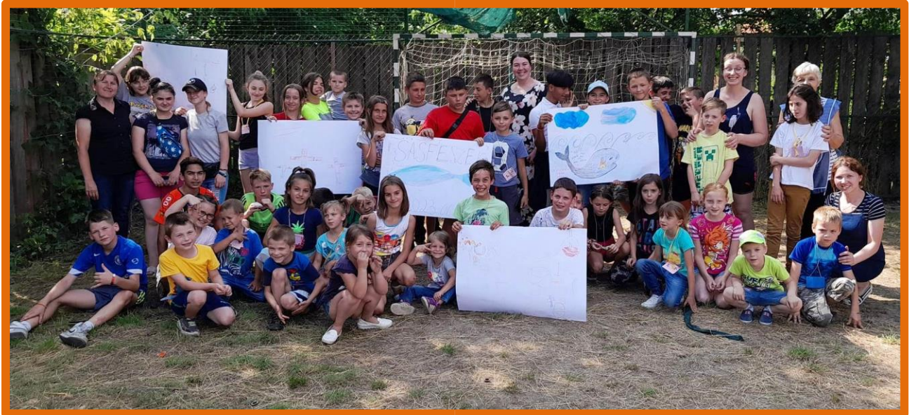
Zomerkamp 2023 groepsfoto

We zijn God dankbaar voor Zijn hulp in het moeilijke jaar 2023. Voor 2024 stellen we onze hoop ook op Hem en bidden we dat de oorlog zal eindigen.